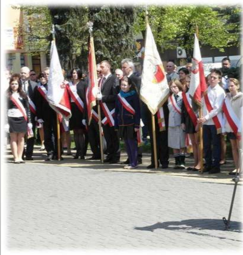
Narodowe Święto Trzeciego Maja