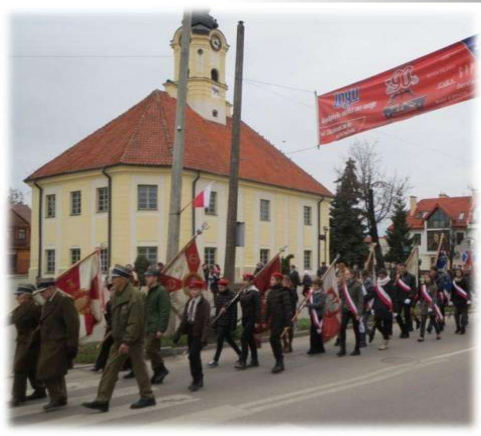
Narodowe Święto Niepodległości