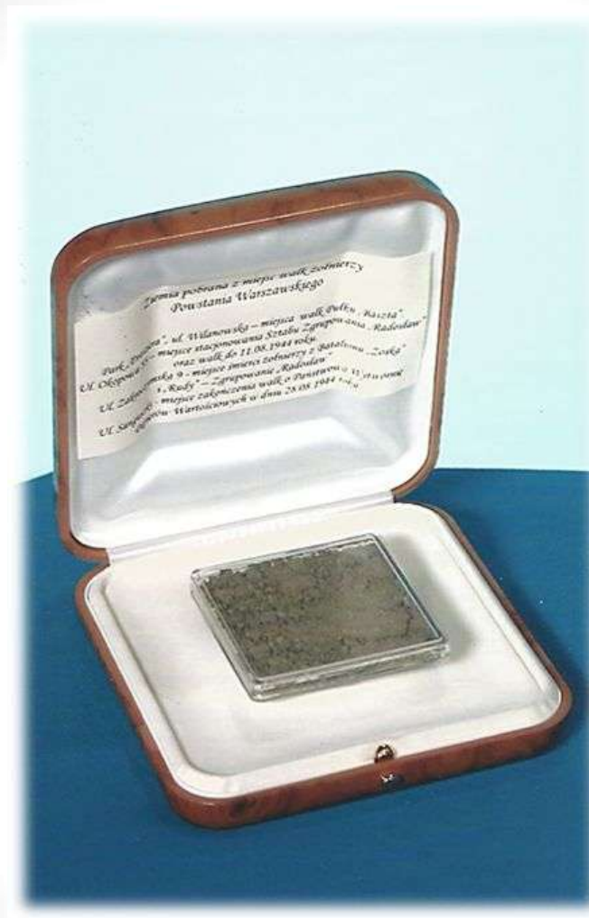
Kapsuła z ziemią z miejsc walk żołnierzy Powstania Warszawskiego