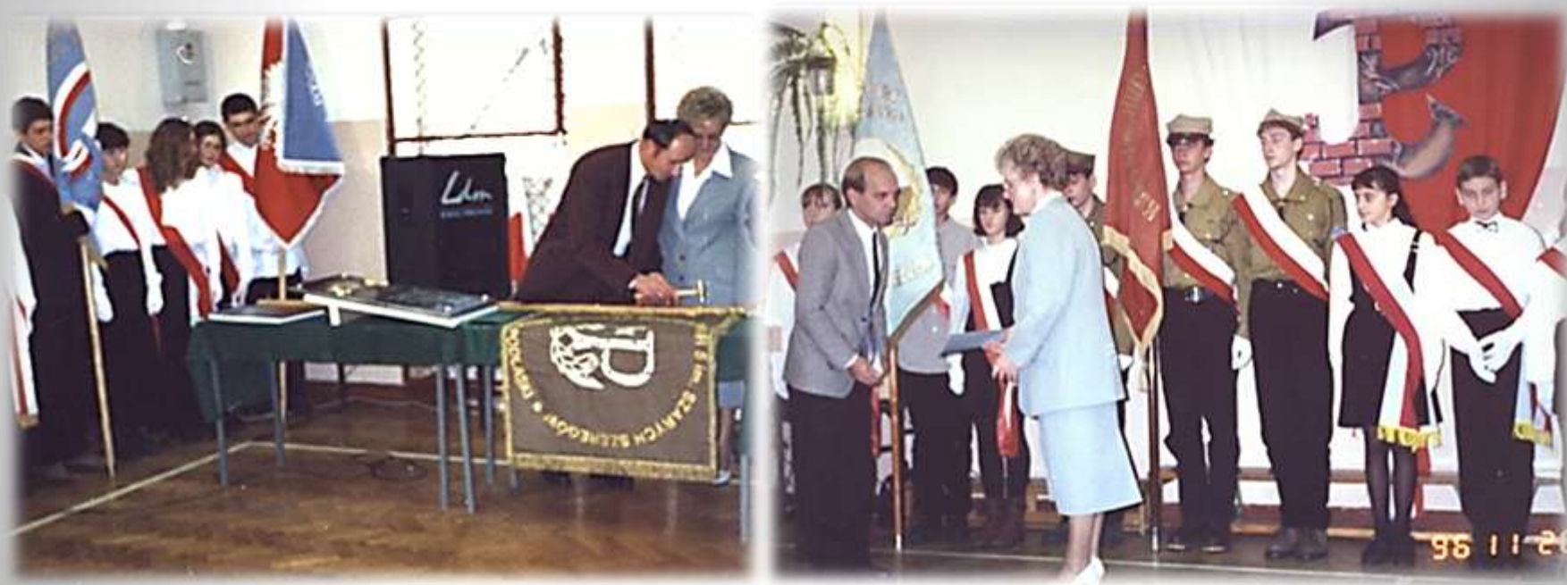
Moment nadania szkole imienia Szarych Szeregów

Szkoła otrzymała ufundowany przez Radę Rodziców sztandar oraz pamiątkową tablicę - dar Światowego Związku Żołnierzy Armii Krajowej Obwodu Bielsk Podlaski, którą umieszczono na frontonie budynku szkoły.