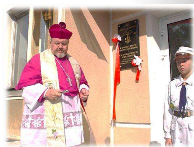
Odślonienie tablicy z okazji 65. rocznicy powstania Szarych Szeregów i 60. rocznicy Powstania Warszawskiego