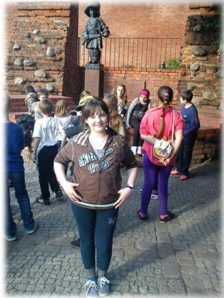
Przy pomniku Małego Powstańca