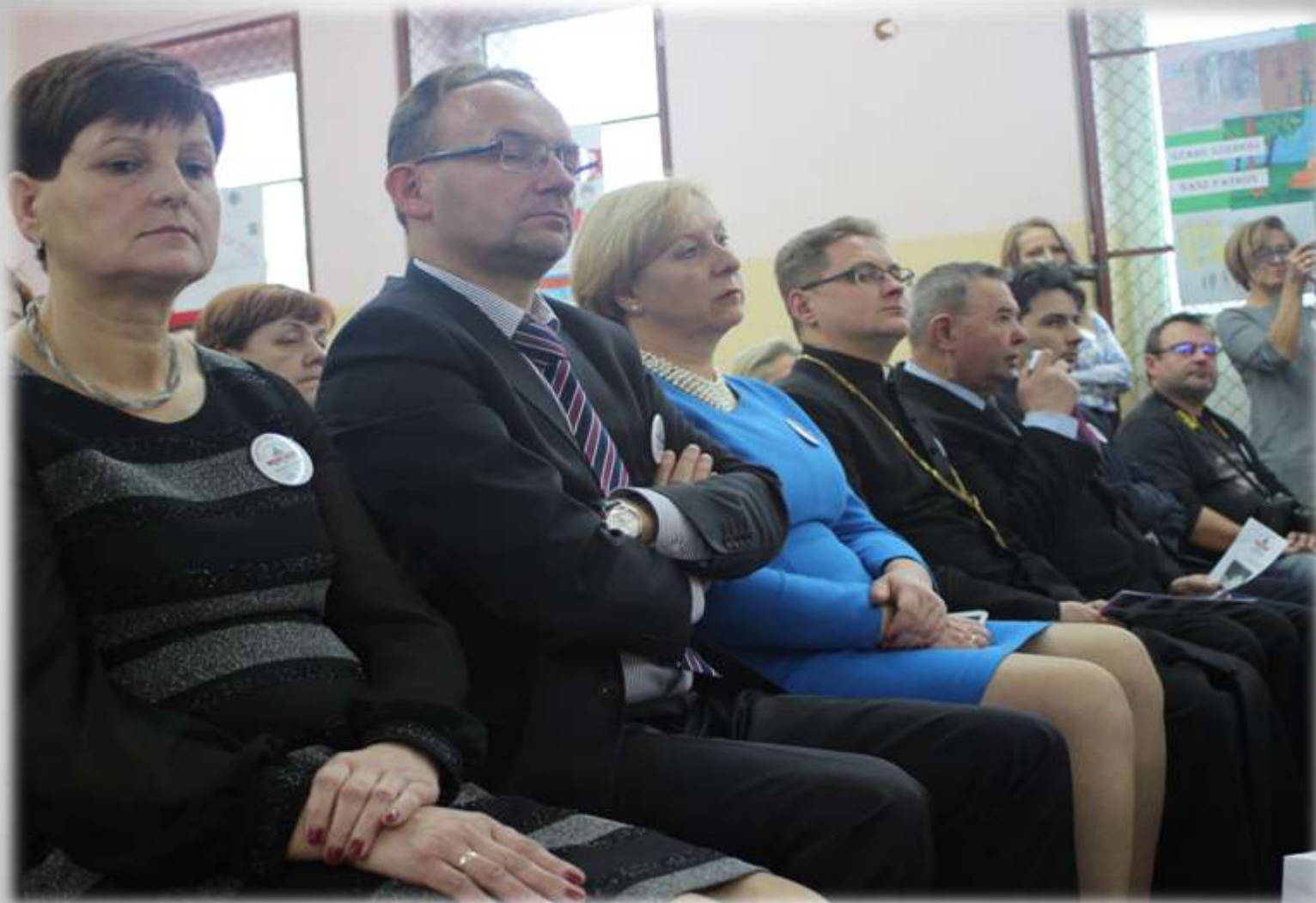
Podczas uroczystości obecni byli znamienici goście, m.in. przedstawiciele duchowieństwa, władz samorządowych i oświatowych