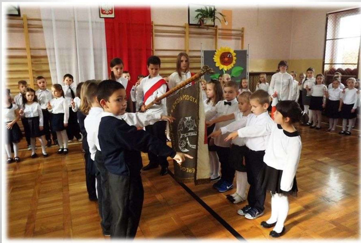
Sługowanie klas pierwszych

Pełnienie służby w poczcie sztandarowej szkoły jest honorową asystą sztandaru. Skład poczty stanowią uczniowie klas szóstych. Sztandar reprezentuje szkołę w najważniejszych uroczystościach szkolnych, patriotycznych i religijnych.